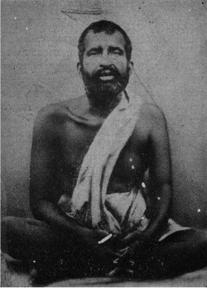
भगवान् श्रीरामकृष्ण परमहंस.